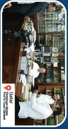
Oatar Prestium dengan Prodi dan Tuisi Qadamat